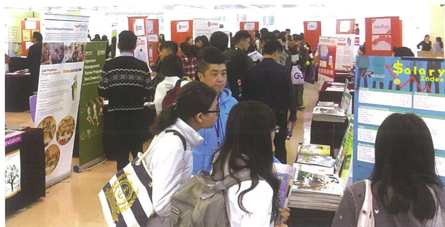
▲ 職業展覽 (Career Fair) 於3月6-7日舉行。