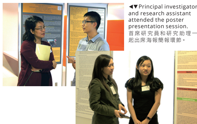
◀▼ Principal investigator and research assistant attended the poster presentation session. 首席研究員和研究助理一 起出席海報簡報環節。