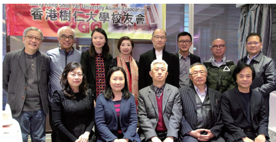
▲ 仁大高層管理人員與校友會管理委員會成員合照。