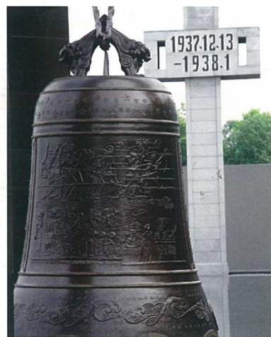
▲ 侵華日軍南京大屠殺遇難同胞紀念館的和平大鐘，表達對和平的渴盼與期待。