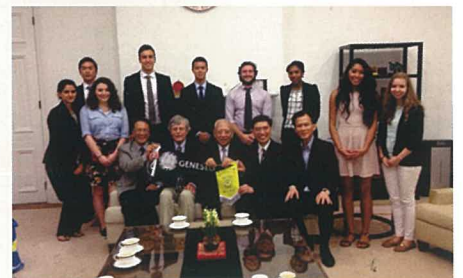
▲ 美國師生與董建華先生 (前排中) 合照。

香港樹仁大學歷史系與美國紐約州立大學傑納西奧分校 (State University of New York at Geneseo) 在 2015 年 6 月，合辦第二屆「中美學生暑期文化交流及學習課程」(Summer Course for Sino-American Inter-Cultural Studies)，近 20 名美國師生不但在仁大校園上課，還參訪了多個不同的機構和景點。