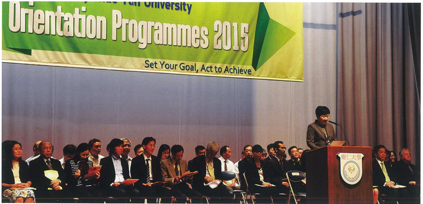
仁大2015年申請和錄取人數