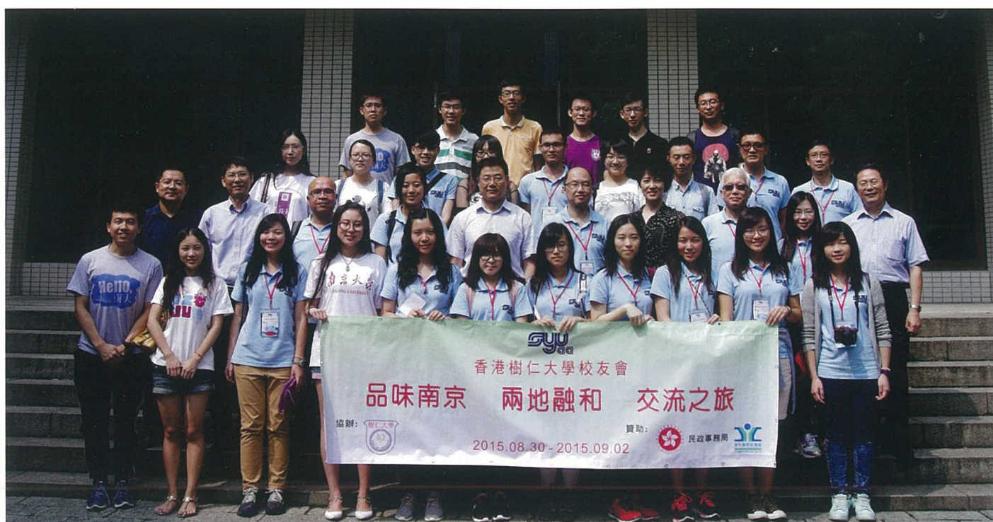
▲ 交流團成員在南京大學校友總會辦公地點所在的知行樓外，與大學管理層合照。

香港樹仁大學校友會成立35周年的其中重點活動——「品味南京 兩地融和 交流之旅」，已於2015年8月30日至9月2日順利舉行。校友會一行17人，拜訪了南京大學、常州科教城，也參觀了常州武進國家高新技術產業開發區、武進科創中心，以及多所不同業務性質的企業，了解他們的業務發展概況，讓同學拓展視野，為未來學術和事業發展奠定基礎，並親身感受國家發展的步伐。