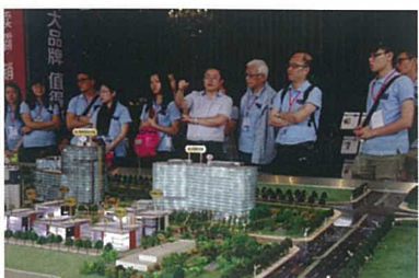
▲ 交流團參觀常州天安數碼城，了解城區發展規劃。