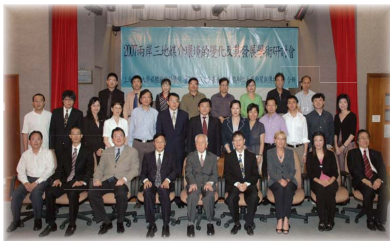
出席研討會的兩岸三地學者合照。

校監胡鴻烈博士在研討會開幕致辭時表示，《禮記》云：「建國軍民，教學為先。」教育除了令人明白過去之外，亦要建構未來。「在近年新聞事業的發展中，最大的轉變莫過於網絡時代的來臨，是次研討會亦有不少論文涉及相關的話題，正好是一次難得的機會，好讓兩岸三地的新聞傳播學精英，透過討論交流，看清新時代的最頂端的學問知識，讓我們從沉重的近代百年，走到尖端的網絡世代。」