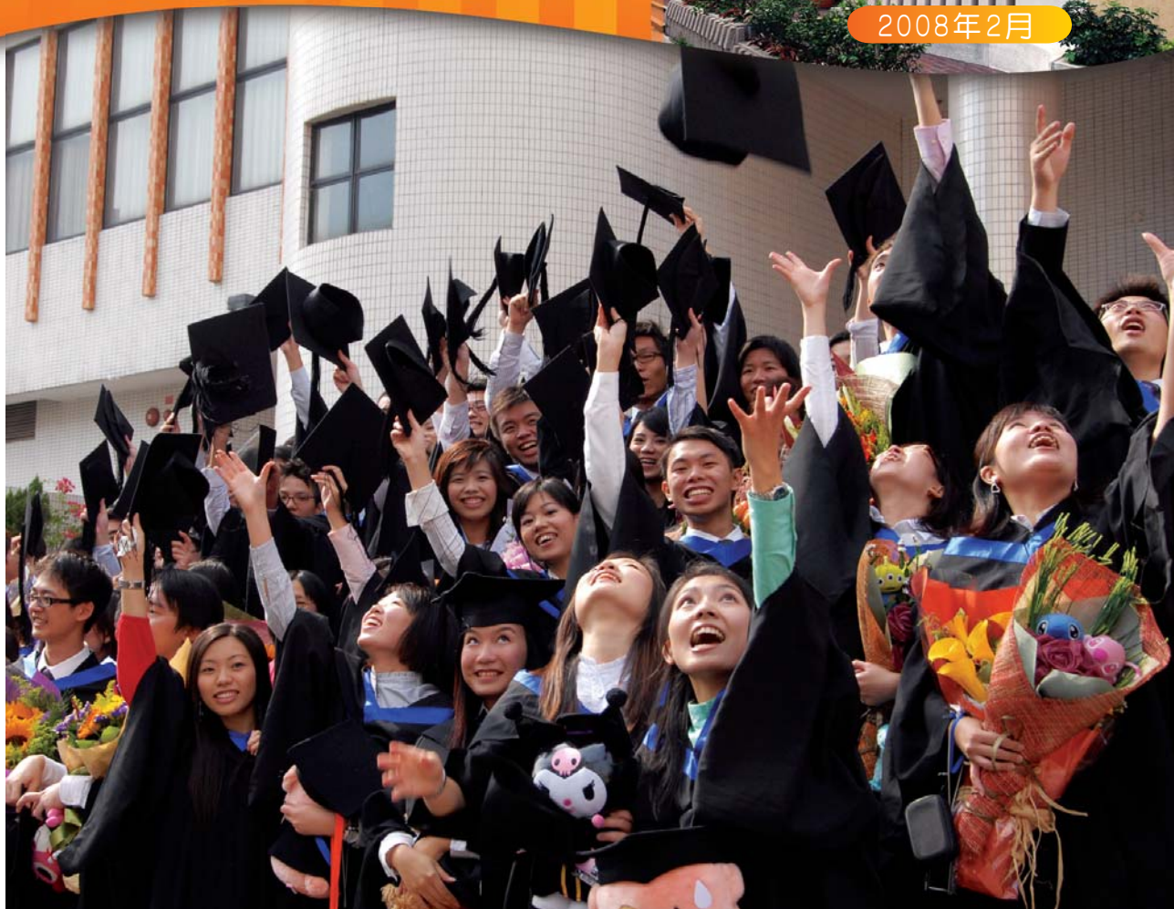
將禮帽拋上天空，象徵畢業生跨進人生另一個階段。

Graduating students threw their hats into the air, and a new stage of their life began.