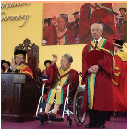
校監和校長接受教院頒授榮譽博士學位。

Students are working even harder now. With the best wishes and hopes from all, graduates are making the society a better place to live.