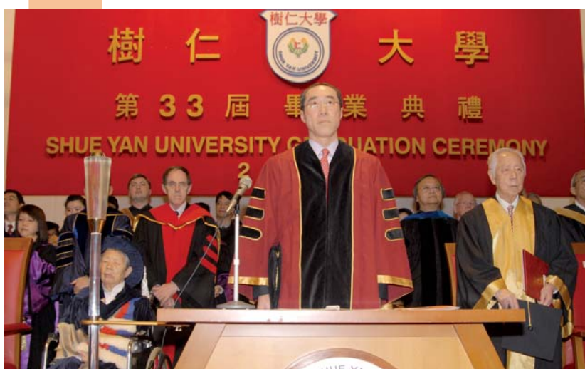
署理行政長官唐英年任文學院畢業禮的主禮嘉賓。 The Acting Chief Executive, Mr. Henry Tang, attended the afternoon session of the graduation ceremony.