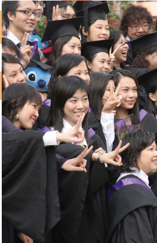
Graduating students taking photos for the memorable event.

292 in the Faculty of Arts, 165 in the Faculty of Social Sciences and 337 in the Faculty of Commerce. Encouragingly, of those graduating, there are 622 students with honor