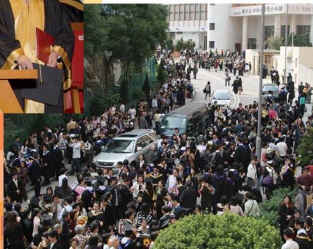
畢業禮當天，畢業生和他們的親友擠滿了慧翠道。

Graduating students and their parents and friends crowded into the Wai Tsui Crescent.