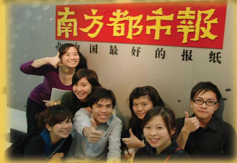
交流團在行程第二天參觀南方都市報社。

40名仁大新傳系學生在去年11月14日至15日，參加了由中央人民政府駐香港特別行政區聯絡辦公室青年工作部組織的「廣州傳媒學生學習交流團」。