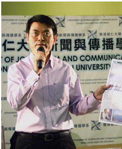
邱騰華呼籲仁大學生過綠色生活。

邱騰華強調，香港要減少固體廢物，在廢物產生的源頭開展分類和回收是其中一種可行的辦法。他承諾政府將大力推廣源頭回收及在更多大廈添置分類回收箱。他呼籲香港人身體力行，養成不浪費的習慣，例如在購買樽裝飲品或拿膠袋前，先想一想是否「必需」。掉棄垃圾前先進行分類，協助回收業將廢物循環再造。他又說，政府會提供土地和收取較低地價，協助回收業在本港發展。